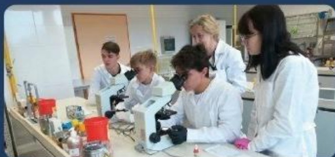
UMED - zajęcia laboratoryjne