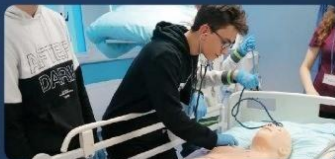
Centrum Symulacji Medycznych UMED w Łodzi