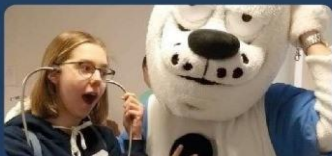
Drzwi Otwarte Uniwersytetu Medycznego w Łodzi