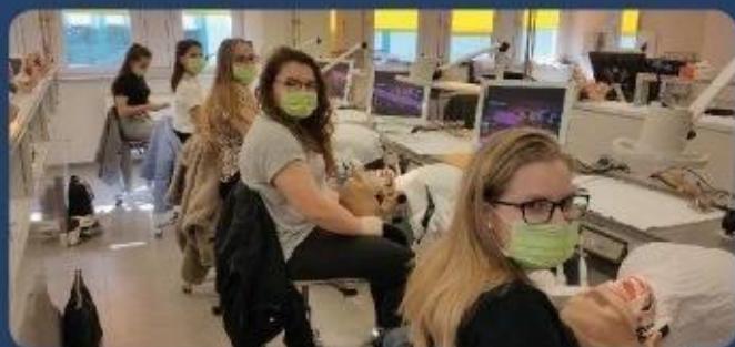
Wydział Stomatologiczny Uniwersytetu Medycznego w Łodzi