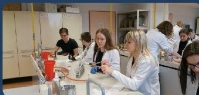
Wydział Mikrobiologii Uniwersytetu Łódzkiego