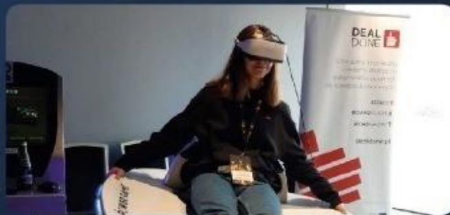
Nowoczesne technologie z Politechniką