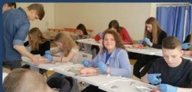
Warsztaty szycia chirurgicznego