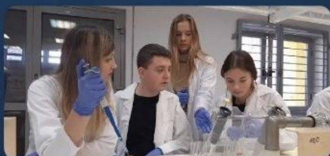
UMED - zajęcia laboratoryjne